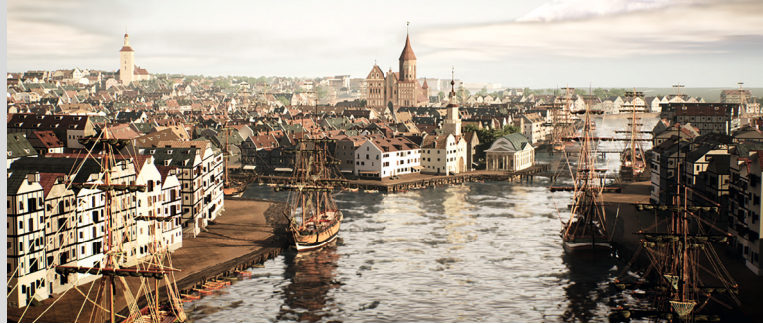
↑ Ansicht des virtuell rekonstruierten Königsbergs im 18. Jahrhundert

Das neue Kant-Museum ist die erste Dauerausstellung in der Bundesrepublik Deutschland zu Immanuel Kant, dem revolutionären Denker der Aufklärung. Einzigartige Objekte zeigen den Menschen Kant, im Zentrum stehen aber seine Ideen und ihr Einfluss auf unsere heutige Welt.