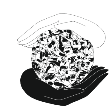
↑ Menschenrechte Illustration von Joni Marriott, 2025

Following a biographical introduction, the exhibition is divided into three main areas: knowledge, morality, and politics. Throughout the exhibition, visitors are invited to consider: How does Kant’s thinking impact us today? How can we critically develop his ideas further? Explore the variety of the individual stations.