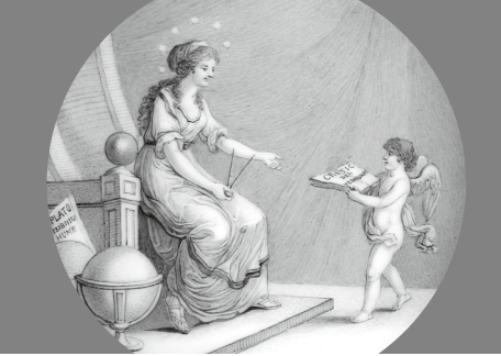
↑ Detail einer Untertasse aus dem Haushalt von Kant KPM 1795 Leihgabe Stiftung Königsberg