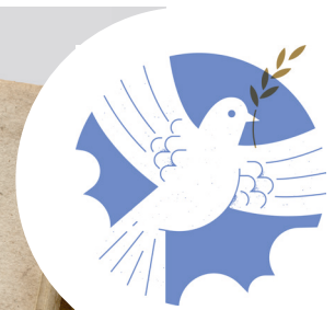
↑ Friedenstaube Grafik von Bureau Stabil, 2025