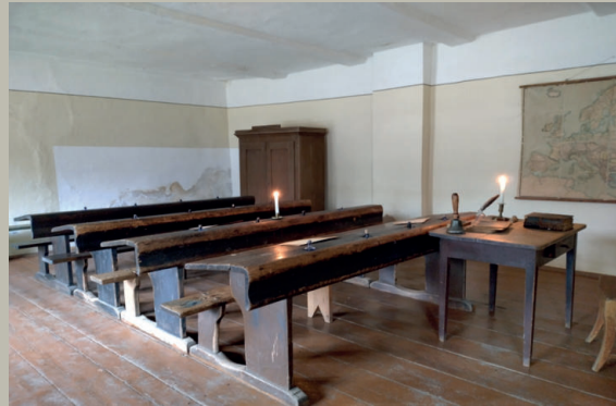
Klassenzimmer im Kubala-Schulmuseum in Lettland, 20.3.2024

Die Ausstellung gibt einen Einblick in einflussreiche Bildungseinrichtungen für Deutschbalten, Esten und Letten. Von der ältesten Schule im Baltikum, der Domschule in Riga, über das berühmte livländische Landesgymnasium in Birkenruh oder das estnische Hugo-Treffner-Gymnasium in Tartu bis zur Baltenschule mit Internat in Misdroy. Sie zeichnet so wichtige Etappen der baltischen Bildungsgeschichte vom Mittelalter bis zur Gegenwart nach.