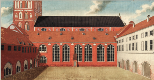
Innenhof des Rigaer Domes (Domschule), Aquarell 1786. Brotze, J. Chr., Monumente, Bd. IV, Bl. 192 © Lettische Universitätsbibliothek Riga.

Bildung ist ein Schlüsselthema der baltischen Geschichte. Über Jahrhunderte beeinflusste die deutsche Oberschicht die Orte, Strukturen und Konzepte der Bildung im Baltikum: von der kirchlichen Bildung im Mittelalter bis zur Hochschulbildung an der Kaiserlichen Universität Dorpat/Tartu.