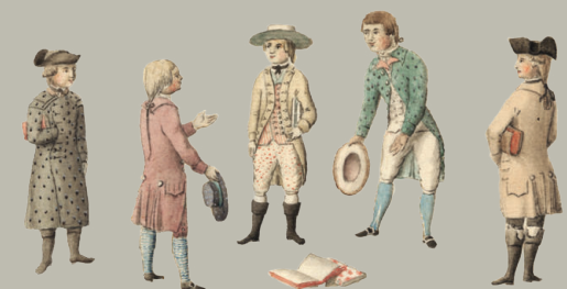
Mannigfaltigkeiten von Riga. Brotze, J. Chr., Monumente, Bd. III, Bl. 66 (Ausschnitt), © Lettische Universitätsbibliothek Riga.