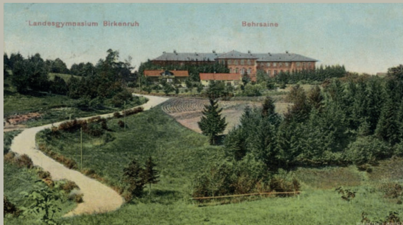
Landesgymnasium Birkenruh/Behraains (1915), Postkarte

Die baltischen Bildungseinrichtungen waren Ausdruck einer nach Ständen gegliederten Gesellschaft. Sie zeigten das Ungleichgewicht zwischen Elite und Mehrheitsbevölkerung auf. Gleichzeitig beanspruchten sie in vielerlei Hinsicht ein gerade durch die Aufklärung befördertes idealistisches Versprechen einer Bildung für alle Bevölkerungsteile.